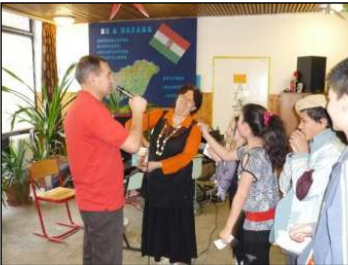
A tombolaszámok kihúzásában igazgató nénink is részt vett.