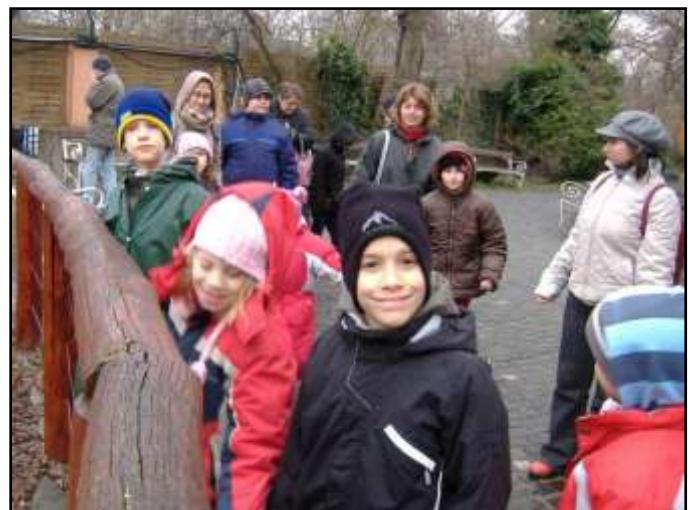
SAJNOS A NAP NEM SÜTÖTT

Örömmel megyünk az állatkertbe, mert rendezvényeik mindig színvonalasak. Így történt ez a VÍZ VILÁGNAPJÁN is. Bár az időjárás nem volt kegyes hozzánk mégis jól éreztük magunkat.