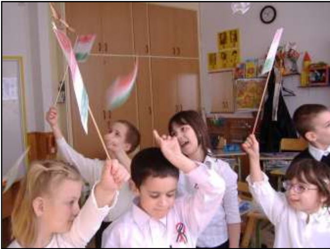
A készülődés már az osztályokban elkezdődött.