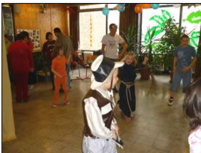
És következett a tánc.