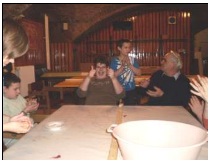
BERCI ILYEN JÓL ÉRZI MAGÁT