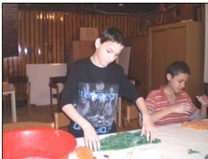
JANÓÉK A FOGLALKOZÁSON