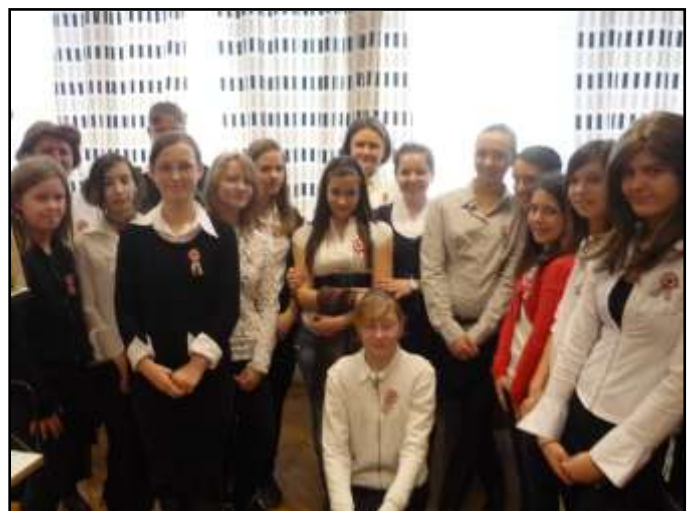
VENDÉGEINK I.sz. ÓUDAI ÁLTALÁNOS ISKOLA TANULÓI