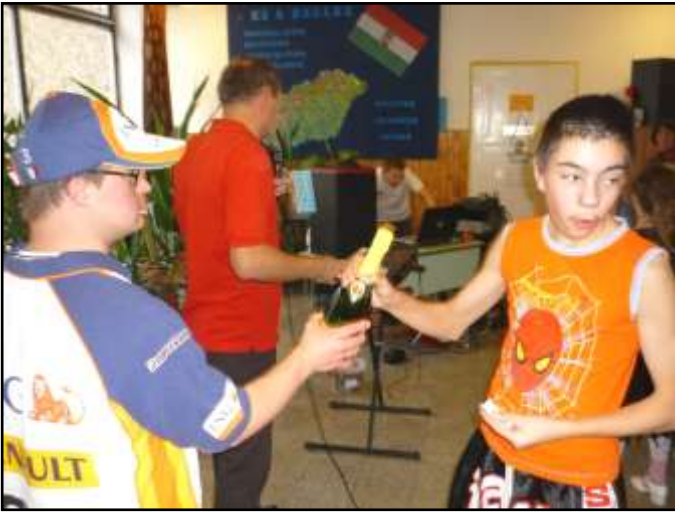
Batman már „civilben” veszi át a kölyökepezsgőt.