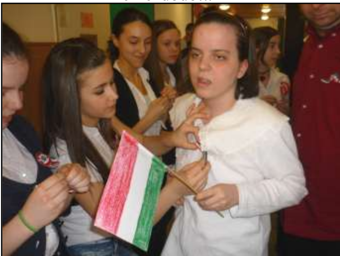
Ajándék kokárda a vendégektől.