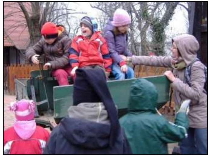
VIDÁM A „KOCISIS” ÉLET